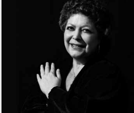
BRIGITTE ENGERER piano