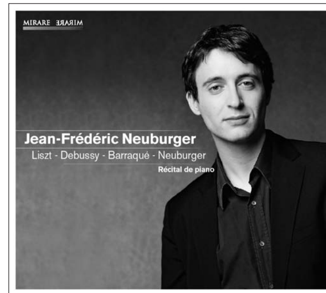
MIR145 Récital de piano